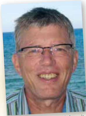
... af Erik Lyhne. VIA University College, læreruddannelsen i Århus

Først og fremmest tillykke med din ph.d.-afhandling om professionel musiklærerpraksis. Kan du give et kort resume af afhandlingen?